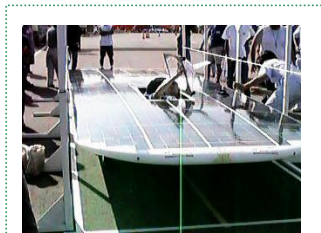
初代ソーラーカーの検査風景

また、日本初の本格的「インターンシップ解説ビデオ(全3巻)」(日経映像)にも出演し、長年の学生への企業体験指導の成果を解説しています。玉川大学初のソーラーカー「スーパーゲンボウ」製作では、電装責任者として部品の購入から設計まで行いました。ドイツ直輸入の10×10cmソーラーセルからのパネル製作、モーターやバッテリーなどの選定を行いました。