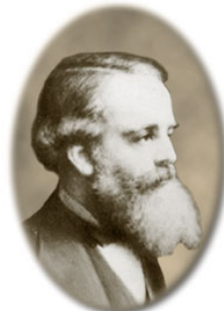
James Clerk Maxwell (1831-1879)

James Clerk Maxwell was one of the greatest scientists of the nineteenth century. He is best known for the formulation of the theory of electromagnetism and in making the connection between light and electromagnetic waves.